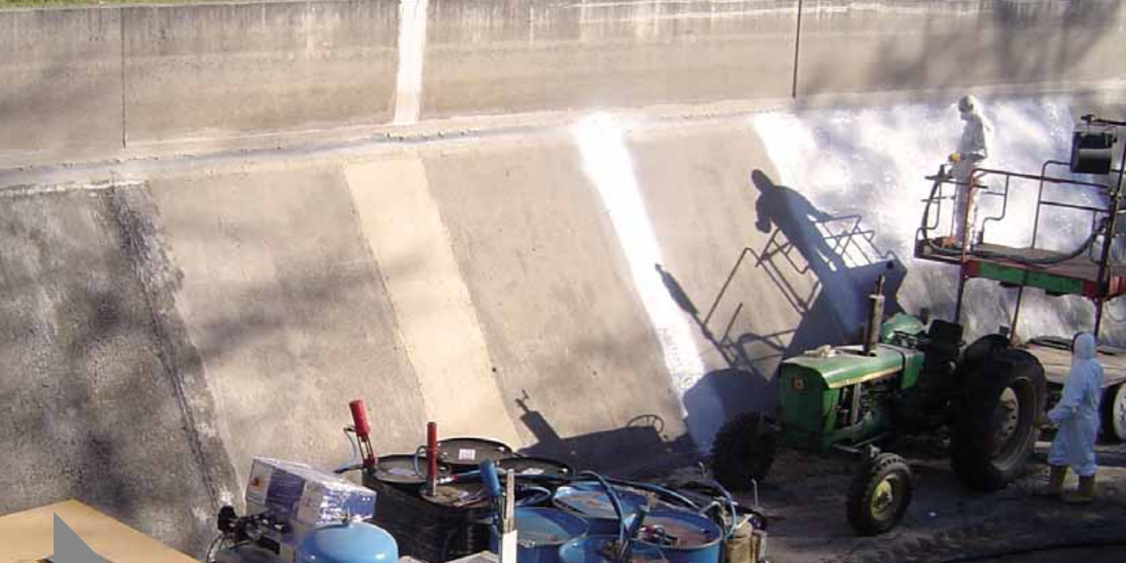
CANAL DE IRRIGACION REGINA HELENA Italia (Novara)

Impermeabilización y protección mecánica de juntas de dilatación.