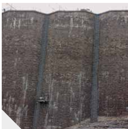
REPRESA DE ENEL Italia

Impermeabilización de superficie y de juntas en acueducto de Vitoria.