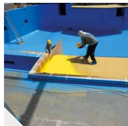
AQUARIUMS Y PISCINAS Europa y Medio Oriente

Reparación de juntas y fisuras existentes en pared de granito de la represa San Giacomo.